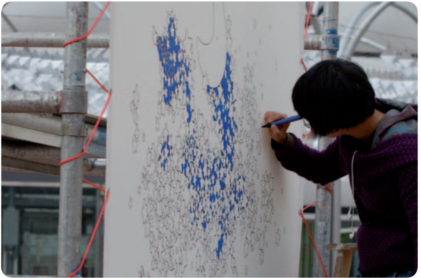
Trần Tran, Flon, Street Painting 2009