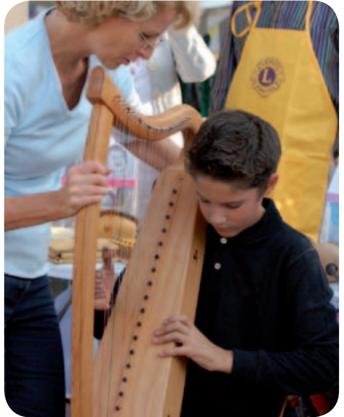
Flon, Street Painting 2009

Nous avons pu une nouvelle fois bénéficier de la grande vente de sapins de Noël de ce club, qui a eu lieu le samedi 5 décembre 2009 à Lutry. Nous les félicitons de cette belle action qui donne l'occasion de partager un moment amical avec les membres de ce club. Merci pour leur grande générosité.