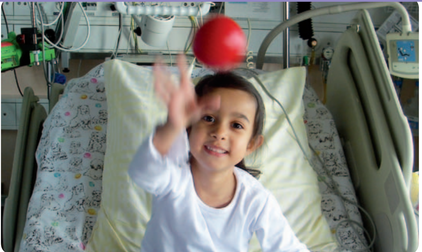
Enfant pratiquant les APA dans une chambre du CHUV