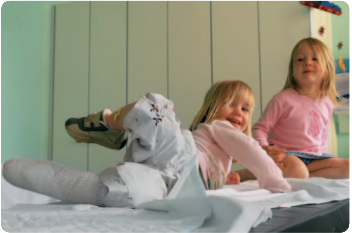
Enfants à l'Hôpital de l'Enfance