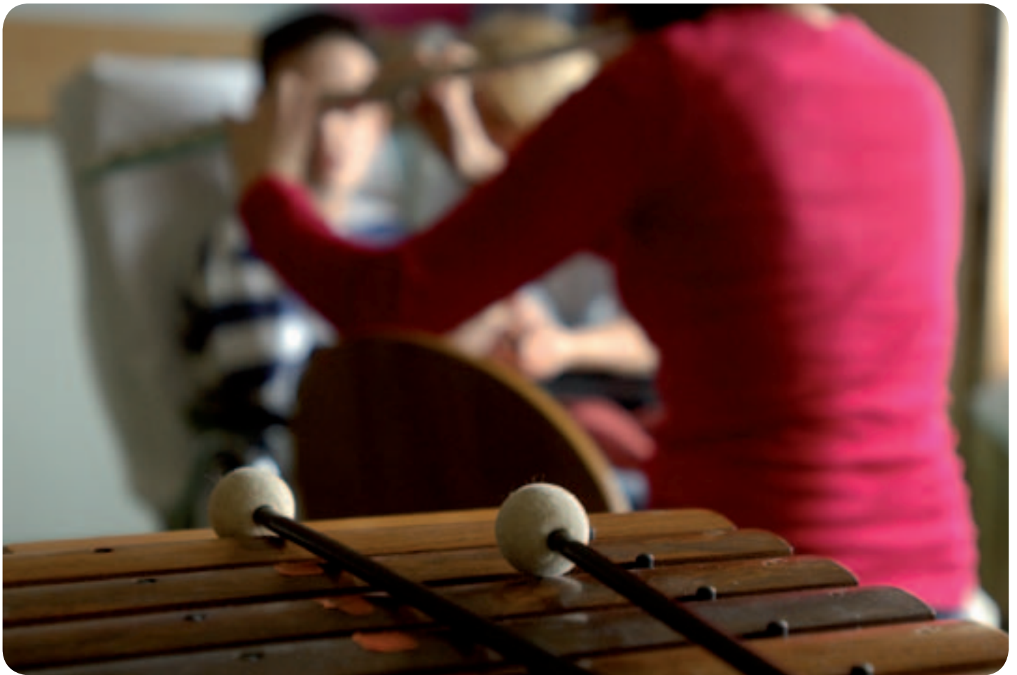
Espace Musique, CHUV